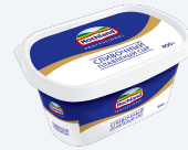
Плавленный сыр Сливочный 400 г