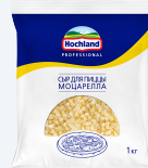
Сыр для пиццы Моцарелла